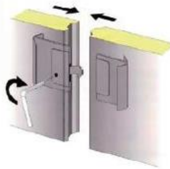
Låsning samt upplåsning av paneler sker med sexkants nyckel